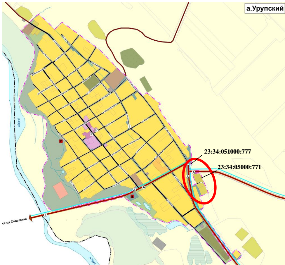
Рисунок 3 – положение расположения участков 23:34:0501000:771 и 23:34:0501000:777 в границах аула

Увеличение земель аула Коноковского происходит за счет полного включения участка с кадастровым номером 23:34:0501000:915 площадью 0,0596 га и части земель сельскохозяйственного назначения для исключения многоконтурности границы, площадь включения составляет 0,0220га.