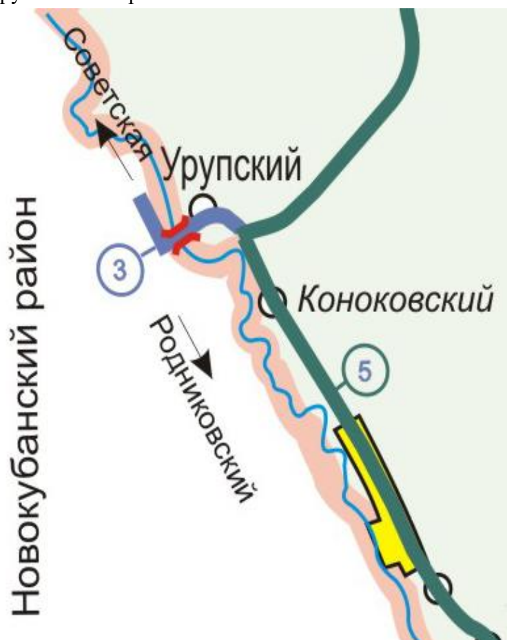
Рисунок 2 – Расположение региональных автомобильных дорог

В Урупском сельском поселении задействованы: автомобильная дорога регионального значения «ст-ца Советская – а. Урупский» и автомобильная дорога межмуниципального значения «с.Коноково – а.Урупский – с.Трехсельское – с.Пантелеймоновское».